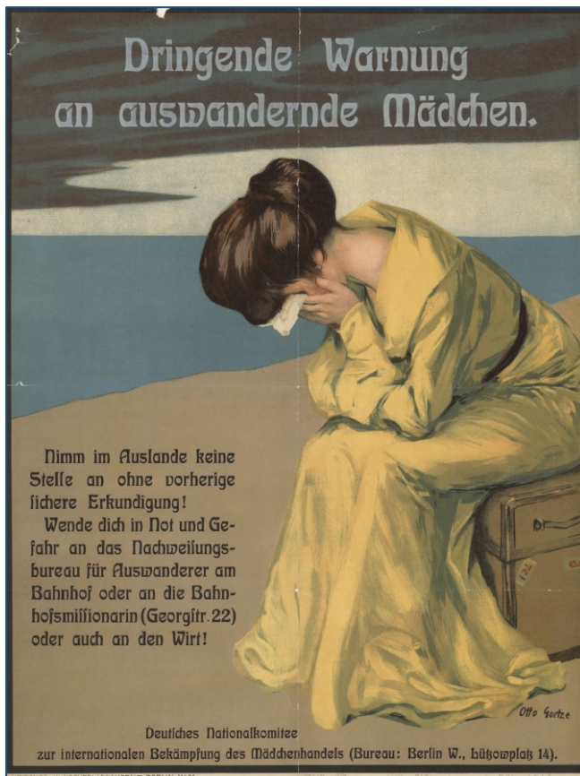
Plakat mit dringender Warnung an auswandernde Mädchen, 1904 Urgent warning to young emigrating women, 1904