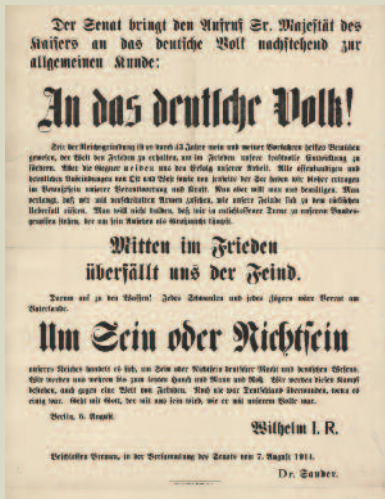
Aufruf des Kaisers vom 6. August 1914, Bekanntgabe durch den Bremer Senat

Das Staatsarchiv Bremen widmet anlässlich des Beginns des Ersten Weltkriegs vor 100 Jahren diesem bislang wenig beachteten Thema eine Ausstellung von Originalen aus seiner umfangreichen Plakatsammlung.