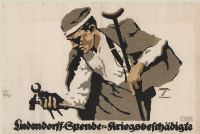
Ludwig Hohlwein, 1918