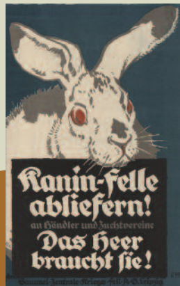
Julius Gipkens, [1917]

Dies galt auch für die großen karitativen Spendenaufrufe zugunsten von Kriegsversehrten wie auch für die Bewerbung lokaler Spendenmaßnahmen, mit denen Einzelne zum individuellen ›Opfer‹ für die gemeinsame Sache angesprochen wurden.